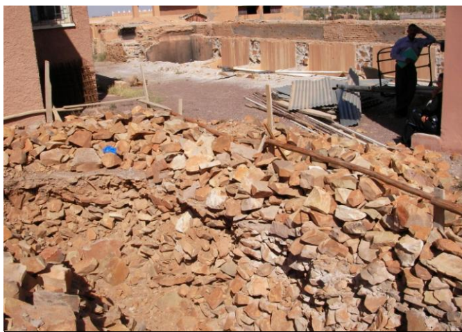
Début du chantier de construction de la maternité, avril 2007